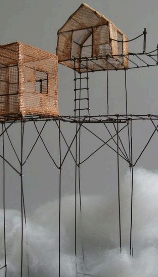
Isabelle Bonté, Fil de Fer